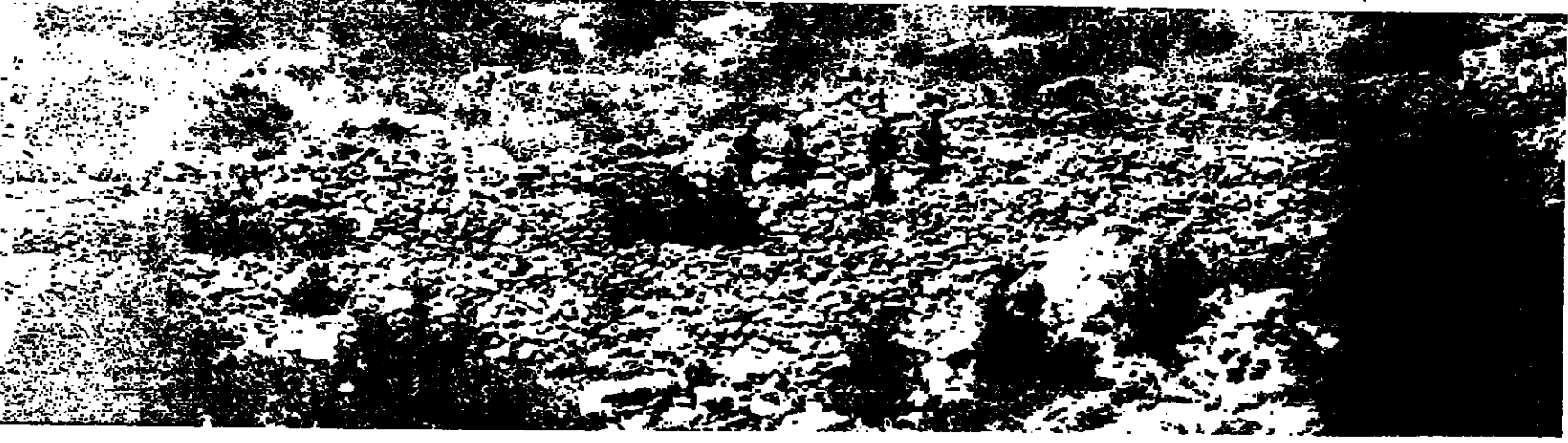
■ اربعة جنود اسرائيليين خارج « عين الشب »